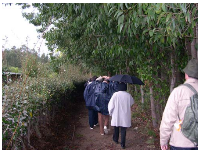
Il cammino nel bosco di eucaliptus