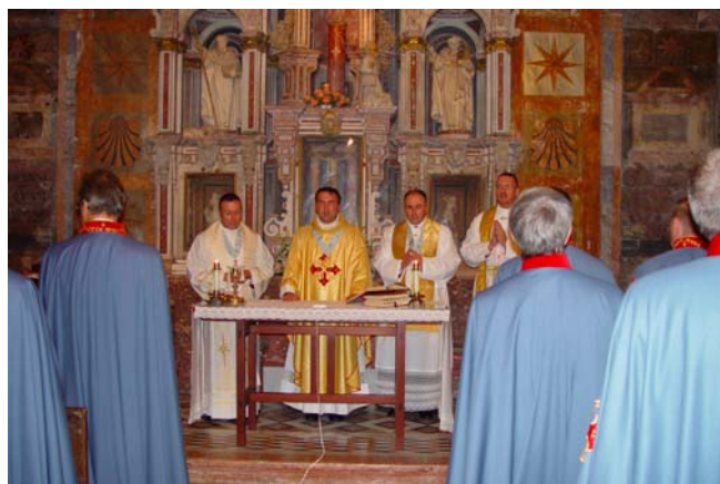
I nostri Cappellani celebrano la S. Messa nella Cappella del Pilar, all'interno della Cattedrale

Alle ore 20,15 i nostri Cappellani hanno celebrato una Santa Messa per i pellegrini nella Cappella del Pilar, all'interno della Cattedrale. E' stato molto emozionante per tutti vedere questo gruppo compatto di mantelli azzurri in uno dei centri più profondi della Cristianità. E' un altro piccolo passo avanti nella direzione di una maggiore spiritualità dei nostri membri, aperta ed offerta con affetto e simpatia a persone che, non necessariamente, condividono interamente la nostra visione di vita.