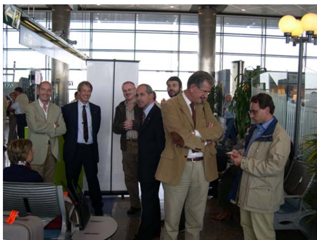
Una prima presa di contatto tra i partecipanti durante una pausa del viaggio, all'aeroporto di Madrid