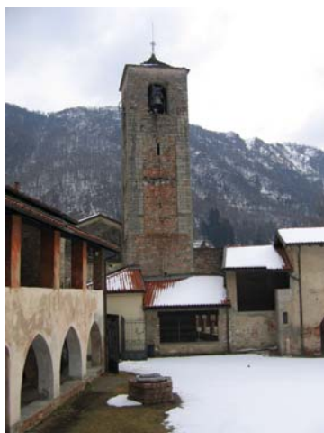
Una veduta dell'esterno