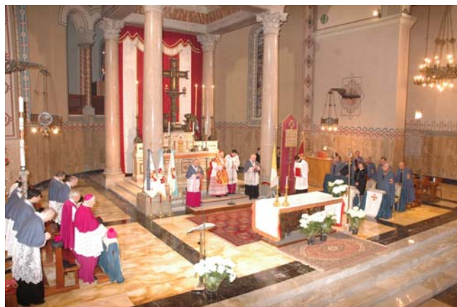
Una veduta generale della Celebrazione Eucaristica