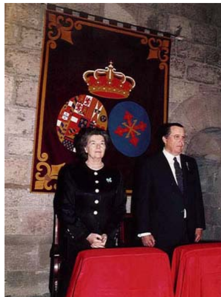
Le Loro Altezze i Duchi di Calabria