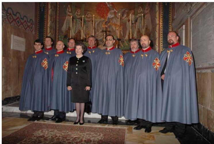
Il Gruppo di Viterbo durante il Pontificale 2005 con S.A.R. la Duchessa di Calabria